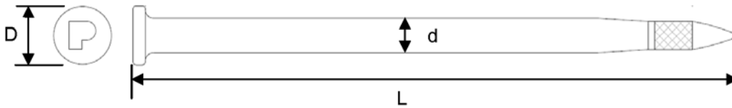
Tabelle 1: Material und Abmessungen