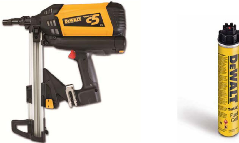
Tabelle 3: Charakteristische Kennwerte, Bemessungsverfahren C

Trak-It® C5 (lange Führungsschiene) and Trak-It® C5-ST (kurze Führungsschiene) 105 Joule gasbetriebenes Setzgerät