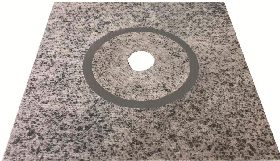
"ASO-Dichtmanschette-K 12 x 12 cm" "ASO-Dichtmanschette-K 15 x 15 cm" or "ASO-Dichtmanschette-K 25 x 25 cm"

elektronische kopie der eta des dibt: eta-17/0469