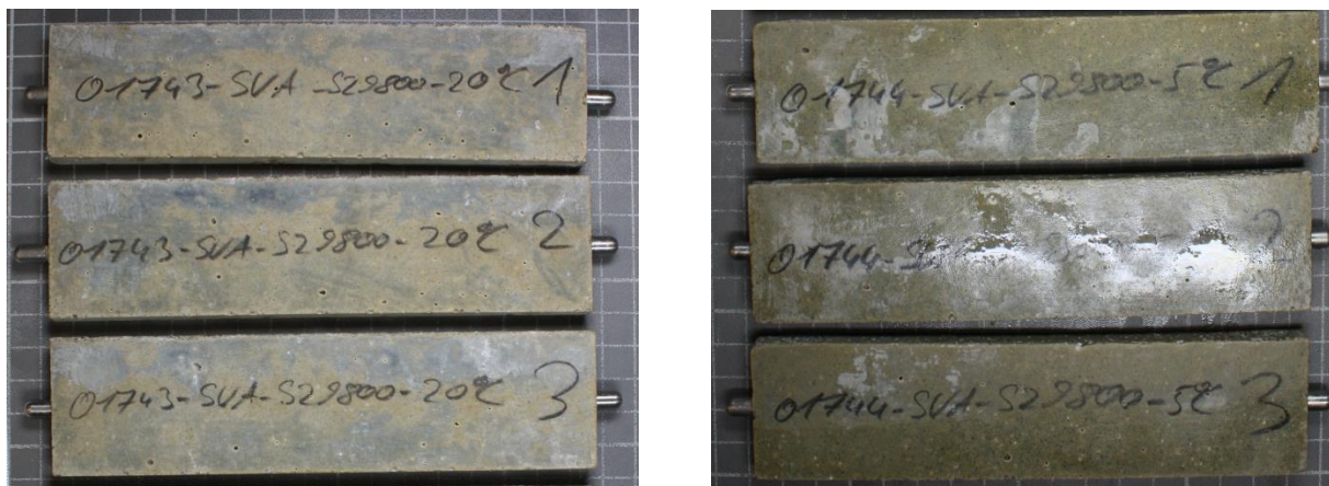
Bild 7: Probekörper aus CEM III/B 42,5 N-LH/SR nach 180 Tagen; Lagerung: in \text{Na}_2\text{O}_4 -Lösung bei 20 °C (links) und 5 °C (rechts)