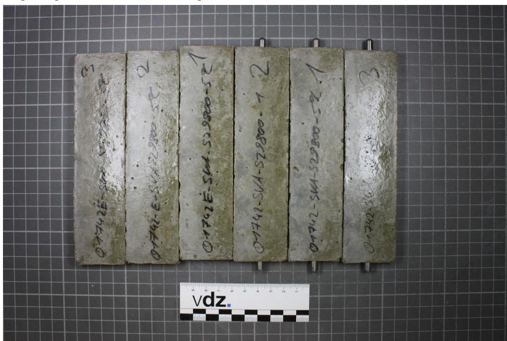
Bild 6: Probekörper aus CEM III/A 52,5 N-SR/LA "Duisburg" mit Hüttensand 2 (S2) nach 180 Tagen; Lagerung: 5 °C in Na 2 O 4 -Lösung

Hochofenzement CEM III/A 52,5 N-SR/LA "Duisburg"