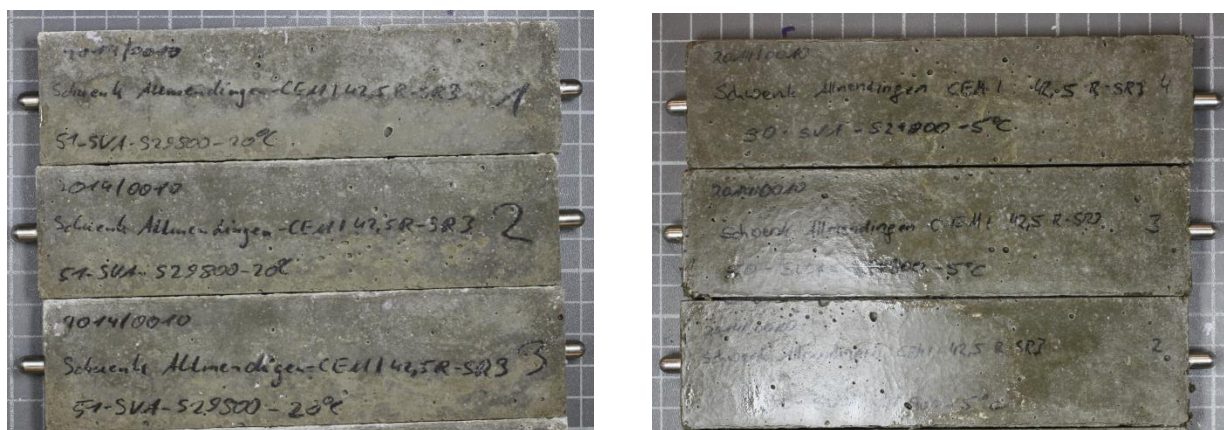
Bild 8: Probekörper aus CEM I 42,5 R-SR3 nach 180 Tagen; Lagerung: in \text{Na}_2\text{O}_4 -Lösung bei 20 °C (links) und 5 °C (rechts)

Hochofenzement CEM III/A 52,5 N-SR/LA "Duisburg"