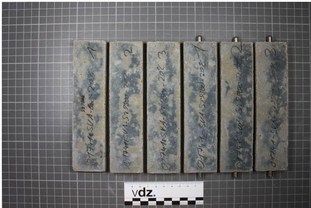
Bild 5: Probekörper aus CEM III/A 52,5 N-SR/LA "Duisburg" mit Hüttensand 2 (S2) nach 180 Tagen; Lagerung: 20 °C in Na 2 O 4 -Lösung