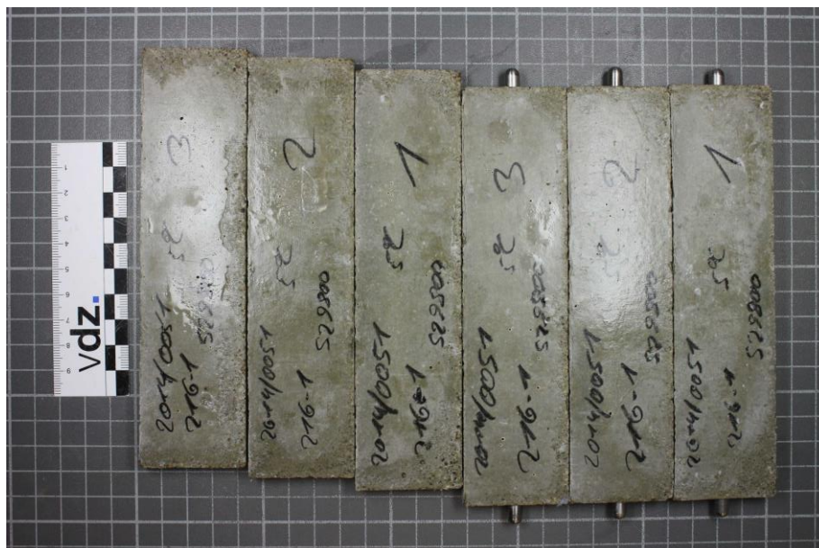
Bild 2: Probekörper aus CEM III/A 52,5 N-SR/LA "Duisburg" mit Hüttensand 1 (S1) nach 180 Tagen; Lagerung: 5 °C in Na_2O_4 -Lösung

Hochofenzement CEM III/A 52,5 N-SR/LA "Duisburg"