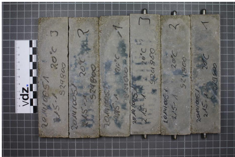
Bild 1: Probekörper aus CEM III/A 52,5 N-SR/LA "Duisburg" mit Hüttensand 1 (S1) nach 180 Tagen; Lagerung: 20 °C in Na_2O_4 -Lösung

Nach einer Prüfdauer von 180 Tagen zeigen die Probekörper keine Verformungen, Risse oder Ablätzungen verursacht durch die Bildung von Thaumasit, siehe Bilder 1 bis 8.