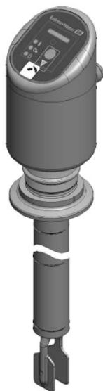
Schema der Überfüllsicherung für den Typ und eingebautem Messumformer DC-PNP / IO-Link